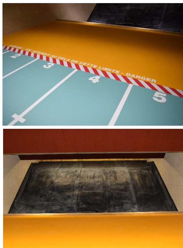
Stand de Tir BA 113 SAINT DIZIER